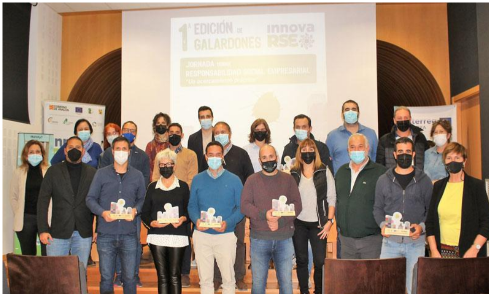
Los galardonados en la jornada organizada en Sariñena.

Han obtenido su sello de responsabilidad social empresarial.