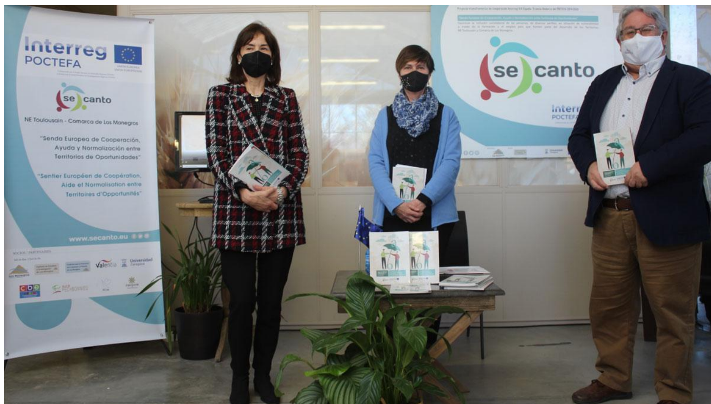
Presentación del manual en las instalaciones de Valentia, en Huesca.

Gracias al proyecto transfronterizo europeo Secanto, la comarca aragonesa distribuirá una guía para ayudar a los profesionales y al voluntariado que trabajan con colectivos vulnerables