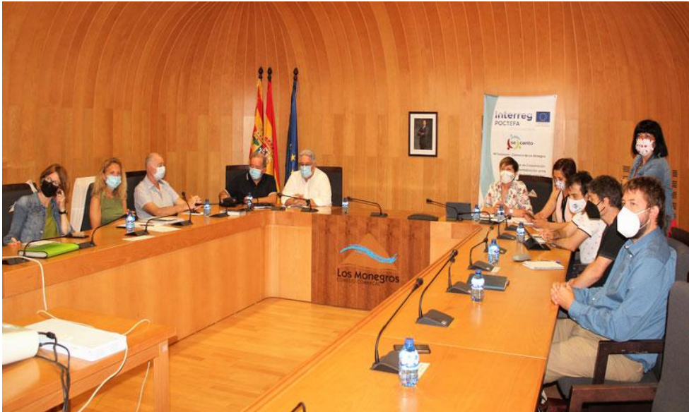
Encuentro de coordinación organizado desde Sariñena.

El programa europeo encara su último semestre.