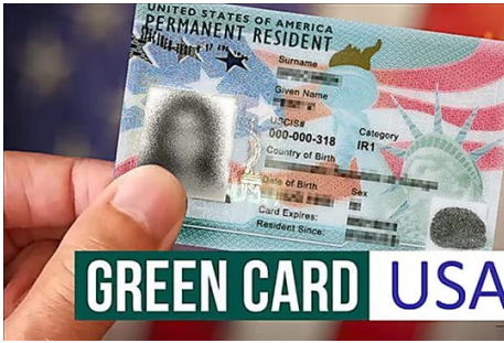
¡El gobierno de EE. UU. anuncia la apertura de la inscripción para la Lotería de... U.S Green Card - Free Check