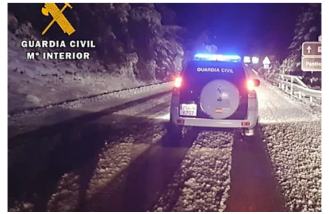
La Guardia Civil de Huesca auxilia a unas diez personas por accidentes por las nevadas