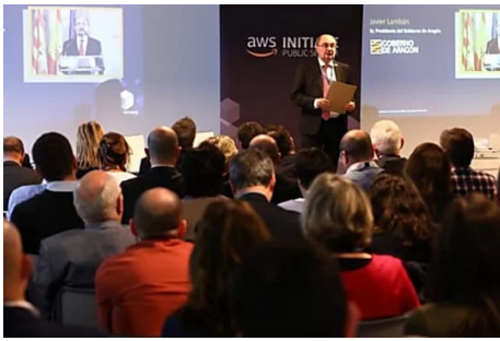
Javier Lambán afirma que el impacto de Amazon "va a ser decisivo y profundo"