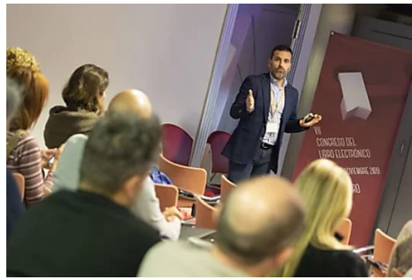
Dos talleres de audiolibros y podcasting abren el VII Congreso del Libro Electrónico