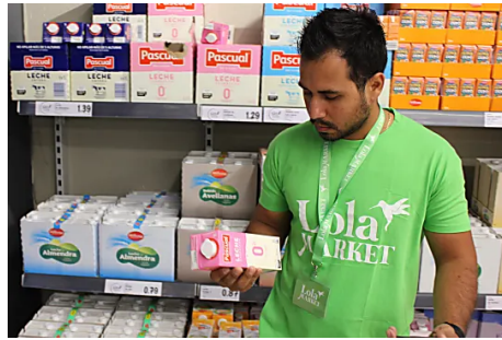
En Barcelona ya tienes un Personal Shopper que hace y te lleva la compra. Lola Market