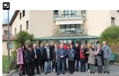
Imagen de los participantes

El Comité de Programación del POCTFA 2014-2020 acaba de aprobar el proyecto europeo SE CANTO, Senda Europea de Cooperación, Ayuda y Normalización entre Territorios de Oportunidades Noreste Toulousain-Comarca de Los Monegros, que tendrá lugar en sendos territorios hasta diciembre de 2020. Su objetivo es la inclusión y el acceso al empleo de las personas en situación de vulnerabilidad, a través de la formación y el empleo y formen parte del desarrollo de ambos territorios. Cuenta con un presupuesto de 1,5 millones de euros, de los que el 65% son fondos FEDER.