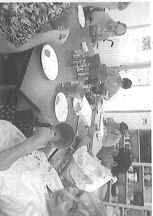
Las instalaciones favorecerían la ocupación de las personas más vulnerables.